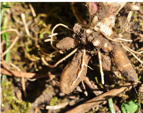
Les racines évoquent celles du dahlia

Comme la plupart des renonculacées, la ficairie fausse renoncule est une plante toxique qui, malgré sa richesse en vitamine C, doit être évitée en usage interne. Une pommade préparée à partir de saindoux et de suc de tubercules préalablement séchés sert à soulager les hémorroïdes.