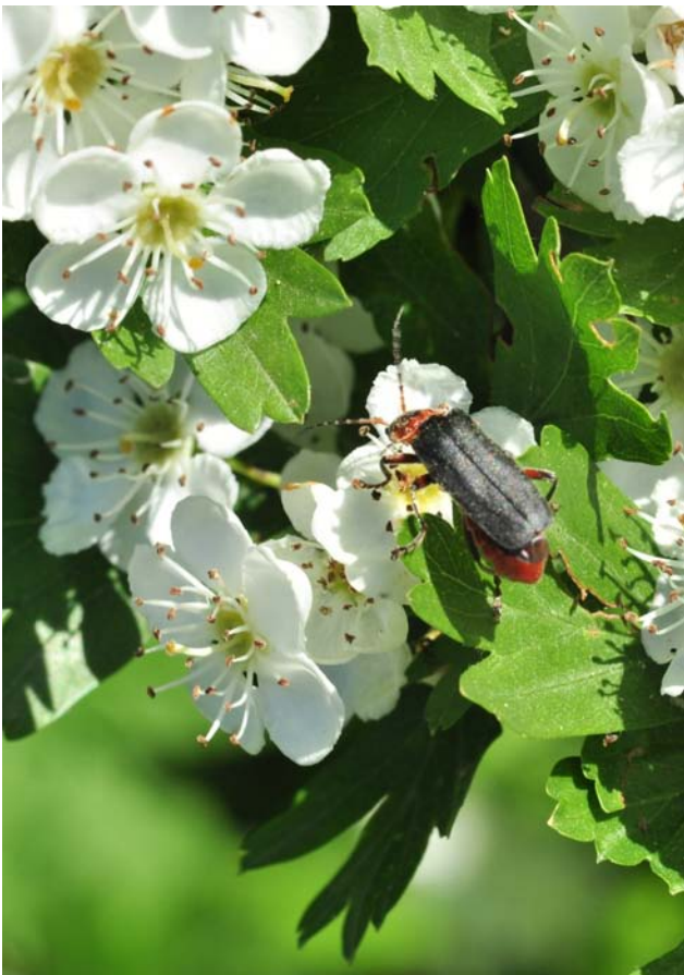
Cantharide rustique ( Cantharis rustica )